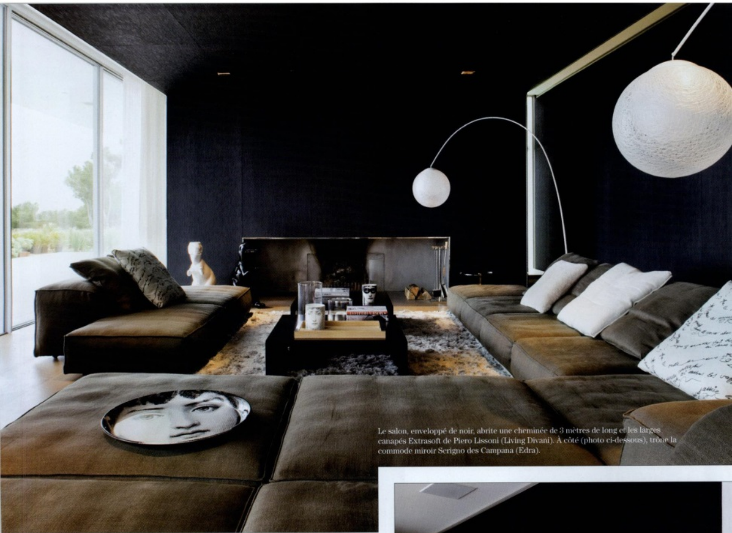
Le salon, enveloppé de noir, abrite une cheminée de 3 mètres de long et les larges canapés Extrasoft de Piero Lissoni (Living Divani). À côté (photo ci-dessous), trône la commode miroir Scigno des Campana (Edra).